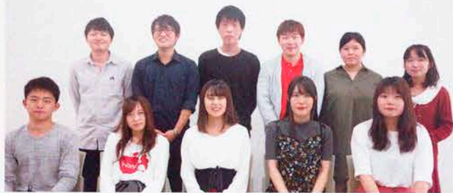
すみれ祭 2018 実行委員会メンバー