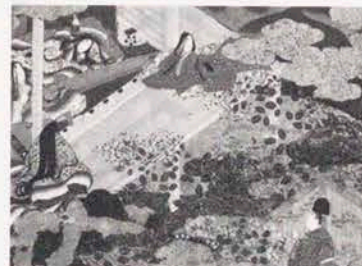
「源氏物語色紙展」展覧会 編纂 三浦和文 栃木県立歴史博物館

お子様や一般の方が気楽に和楽器に親しみ、洋楽器との違いや古典文学との関わりなどを、わかりやすく解説するコンサート形式の公開講座です。