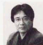
総合プロデュース 直井 研二