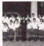
児童合唱団 ボコ・ア・ボコ