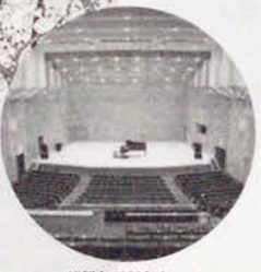
須賀友正記念ホール

児童合唱「竹の子、柿の種と握り飯」 フルードと箏「小鳥の歌」 テノールと箏「平城山、カタリ・カタリ」 フルードとテノールと箏「雲のあなたに」