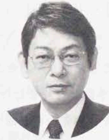
宇都宮短期大学長