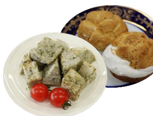
里芋(親芋)レシピ提案