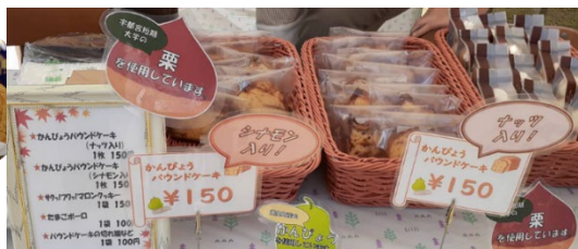
地域の食材を使用したお菓子

これらを通して日々の講義や実験・実習が、実社会の食の支援においてどのように反映されるのかを体験し、科学的根拠や感性に基づく栄養指導・食育の大切さを知り、学修への意欲を高めています。