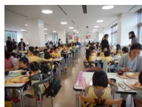
認定こども園昼食支援