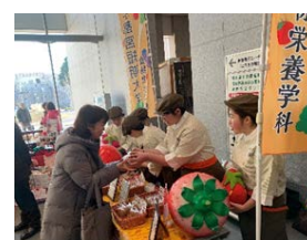
イチゴ王国栃木出店

これらを通して日々の講義や実験・実習が、実社会の食の支援においてどのように反映さ