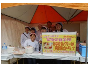
宇都宮市食育フェア